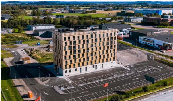
The Stopover hotel in Falkenberg.

Strawberry öppnar Stopover, en ny hotellkedja särskilt anpassad för bilresenärer. Det första hotellet ligger i Falkenberg på västkusten och erbjuder laddstationer för elbilar, restaurang, husdjursvänliga rum, lekrum för barn och gym – perfekt för en bekväm paus längs resan genom Sverige.