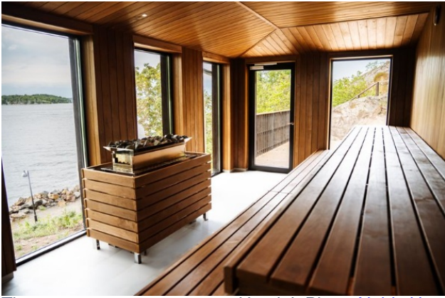
The new panorama sauna at Hotel J.

Hotel J, strax utanför Stockholm, har fått sitt namn från 1930-talets J-klass segelbåtar, kända för sitt fina hantverk och sin eleganta design. Det nyöppnade hotellet erbjuder en stilren nautisk atmosfär, perfekt för avkoppling nära skärgården. Intill ligger Tornvillan från 1889, vars charm noggrant bevarats under renoveringen. Hotellet har rum med havsutsikt, bastu med panoramavy och serverar säsongsbetonade menyer på närbelägna Restaurang J. För mer info. besök https://www.hotelj.com/en/