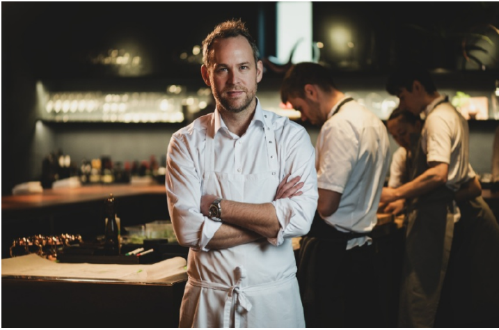
Michelin-starred Björn Frantzén is opening a new restaurant.