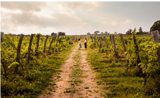
Le domaine viticole d'Arild, sur la péninsule de Kullaberg. Photo: Apelöga ( Télécharger )

L'objectif ? Faire découvrir la nature environnante tout en initiant les participants à la production viticole locale. Plusieurs arrêts de dégustation sont prévus tout au long du parcours avec dîner festif en fin de journée. Des forfaits incluant une nuit sur place sont proposés et peuvent se réserver auprès des hôtels participants, comme le vignoble d'Arild et le Grand Hotel Mölle . Une occasion simple et ludique de découvrir l'une des régions viticoles suédoises en plein essor, même en hiver.