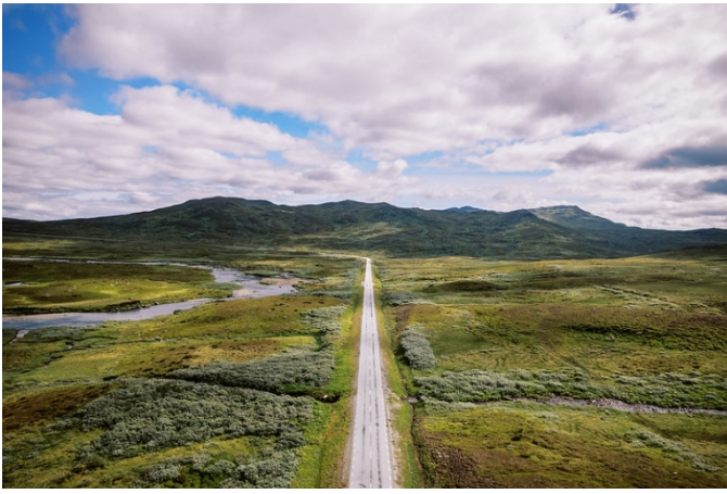
Panorama sur le plateau de Stekenjokk depuis la Wilderness Road.