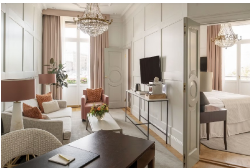
HÄR Grand Hôtel får två nycklar av Michelinguiden Grand Hôtel i Stockholm är ett av fyra hotell i Norden som har tilldelats två nycklar av Michelinguiden . Precis som stjärnorna för restauranger belönar nycklarna "excellens" inom fem kategorier, bland annat arkitektur, karaktär samt kvalitet och konsekvens i service. Michelinguiden ger Grand Hôtel två nycklar tack vare sitt läge, sin klassiska inredning, sin "nästan komiska dekadens" och sin felfria service.