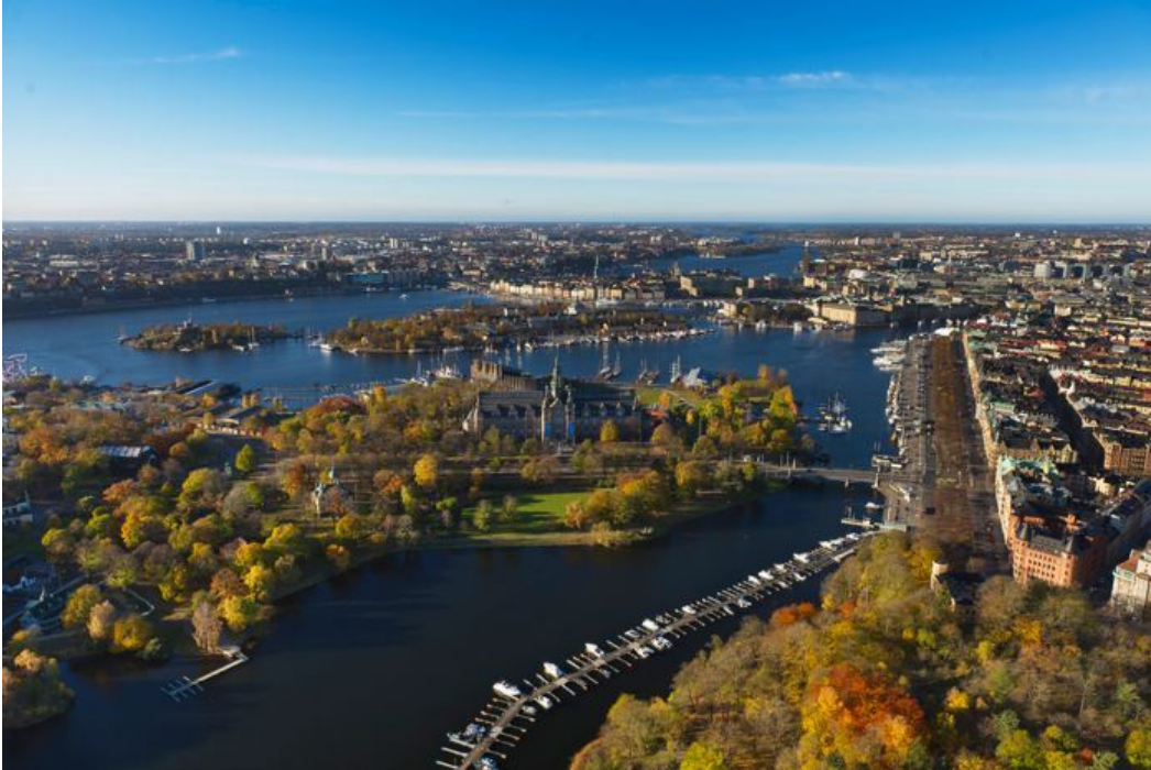
Vue aérienne de Stockholm.

Avec Stockholm désormais classée parmi les 10 meilleures villes européennes selon le prestigieux classement Europe's Best Cities de Resonance Consultancy, et un net regain d'intérêt mondial pour Göteborg et Malmö, les grandes villes suédoises sont sous les projecteurs. Ce nouvel engouement s'explique par un savant équilibre entre vie urbaine, culture, art de vivre à la suédoise et nature accessible* à portée de tram, de ferry ou de vélo. Plus qu'un simple city break, ces villes offrent une véritable évasion. Focus sur les temps forts de l'automne.