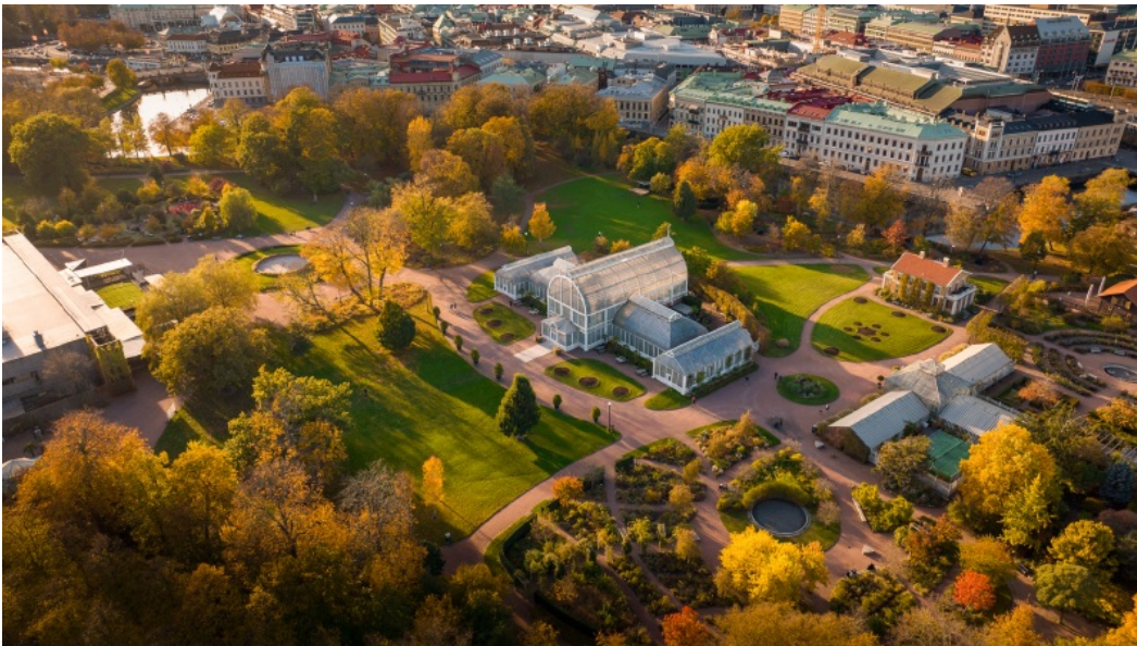
Photo : Vue aérienne de Göteborg.