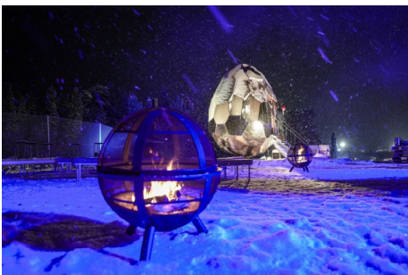
Photo: Inauguration emplacement final Kiruna.Wesley Overklift ( Télécharger )