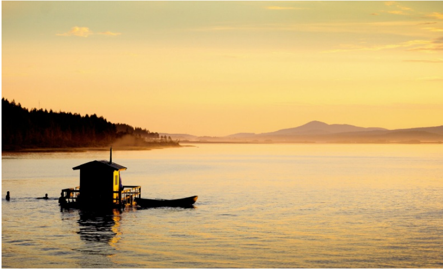
Télécharger

Candidat de la Suède à l'Eurovision, le groupe comique suédo-finlandais KAJ fait sensation avec Bara Bada Bastu (« juste faire un sauna »), un hymne joyeux à l'un des rituels les plus chers au cœur des Suédois : le sauna. Ici, bien-être, traditions séculaires et amour de la nature se mêlent dans une vapeur bienfaisante, aussi essentielle qu'un fika — la fameuse pause-café suédoise. Envie vous aussi de « juste faire un sauna » ? Voici 10 saunas insolites à tester absolument en Suède !