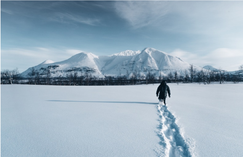
View of Mountain Áhkká in Stora Sjöfallets national park, Jokkmokk. Download HERE

Precis som i den ikoniska julklassikern Ensam hemma 2: Lost in New York där huvudpersonen av misstag hamnar på fel plats, får vi ibland ta del av berättelser då resenärer hamnar på fel plats än den avsedda. Med julen och eventuella semesterresor i antågande kan dessa berättelser bjuda på såväl underhållande anekdoter som värdefull påminnelser om vikten av att dubbelkolla resedetaljerna innan avfärd.