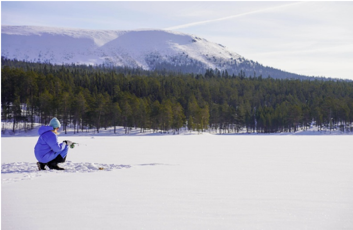
Download

ikoniska lopp finns möjligheter till längdskidåkning i hela landet, från norr till söder, för både erfarna åkare och nybörjare. För mer inspiration klicka HÄR