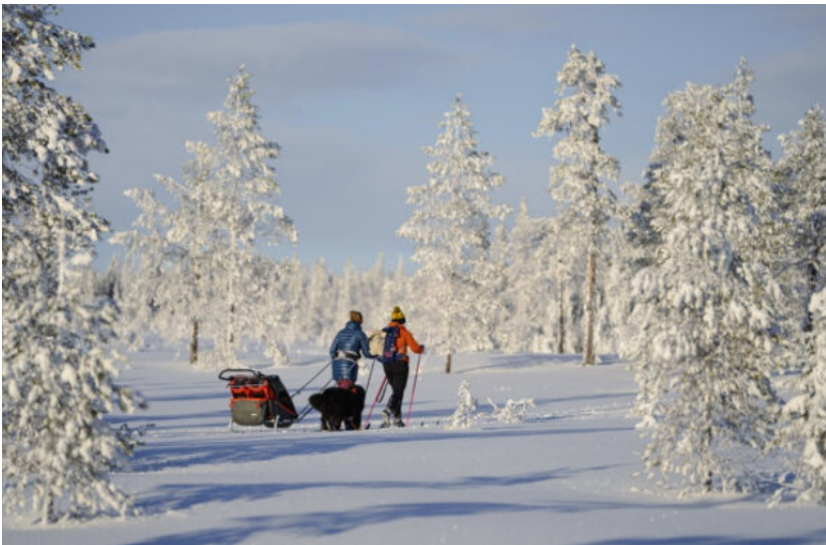
Download

Med över 100 skidorter erbjuder Sverige en mängd varierade alternativ, från familjevänliga anläggningar till utmanande offpist områden. Oavsett om du söker en lugn familjevistelse eller mer krävande åkning, finns här något för alla. För mer inspiration klicka HÄR