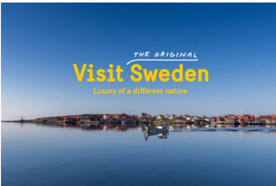
Download

År 2024, när ”dupes” av olika slag trendar i allt från handväskor till bakverk, tar Sverige ett nytt steg för att skydda sin identitet. Medan modevarumärken kan varumärkesskydda sina logotyper och namn, kan länder inte göra det. Det vill Visit Sweden ändra på. För när allt kommer omkring; ingen vill ju att en turist som avser resa till Sverige för att uppleva magisk skärgård, spektakulärt norrsken, svenskt fika och kanske träffa en älg eller två, hamnar i fel Sweden .