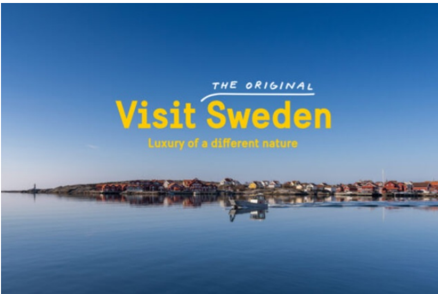
Download

År 2024, när ”dupes” av olika slag trendar i allt från handväskor till bakverk, tar Sverige ett nytt steg för att skydda sin identitet. Medan modevarumärken kan varumärkesskydda sina logotyper och namn, kan länder inte göra det. Det vill Visit Sweden ändra på. För när allt kommer omkring; ingen vill ju att en turist som avser resa till Sverige för att uppleva magisk skärgård, spektakulärt norrsken, svenskt fika och kanske träffa en älg eller två, hamnar i fel Sweden .