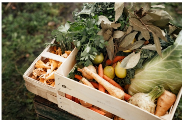
Download

Sverige är en plats där du verkligen kan vara dig själv. Förutom yttrandefrihet och pressfrihet hyllas Sverige som ett av världens mest inkluderande och progressiva länder. Varje år anordnas Pridefestivaler över hela landet - Euro Pride har anordnats här tre gånger under de senaste tre decennierna. Sverige är helt enkelt en perfekt plats för en romantisk semester, oavsett vem du älskar.