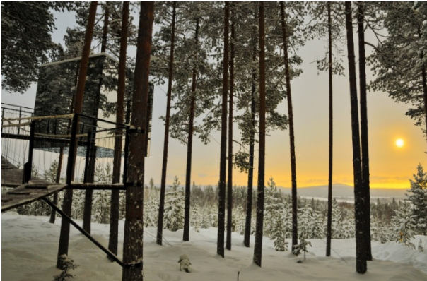
Download

I Sverige gömmer vi inte våra skatter på öde öar, vi delar med oss av dem till alla. Här kan du uppleva världsarv som slott, naturreservat och arkeologiska fyndplatser. Varför inte ta en promenad genom den medeltida staden Visby på Gotland, eller utforska Laponiaområdet i Swedish Lapland, som ligger inom polcirkeln i norra Sverige. Dessa platser är skyddade av UNESCO så att alla kan njuta av dem för alltid.