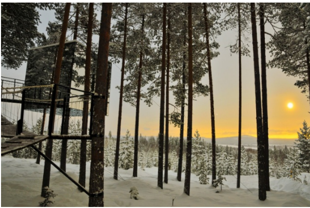
Download

Tidlösa skatter! Sverige gömmer vi inte våra skatter på öde öar, vi delar med oss av dem till alla. Här kan du uppleva världsarv som slott, naturreservat och arkeologiska fyndplatser. Varför inte ta en promenad genom den medeltida staden Visby på Gotland, eller utforska Laponiaområdet i Swedish Lapland, som ligger inom polcirkeln i norra Sverige. Dessa platser är skyddade av UNESCO så att alla kan njuta av dem för alltid.