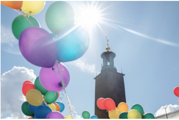
Download

Öppet 24/7 Sverige är en plats där du verkligen kan vara dig själv. Förutom yttrandefrihet och pressfrihet hyllas Sverige som ett av världens mest inkluderande och progressiva länder. Varje år anordnas Pridefestivaler över hela landet - Euro Pride har anordnats här tre gånger under de senaste tre decennierna. Sverige är helt enkelt en perfekt plats för en romantisk semester, oavsett vem du älskar.