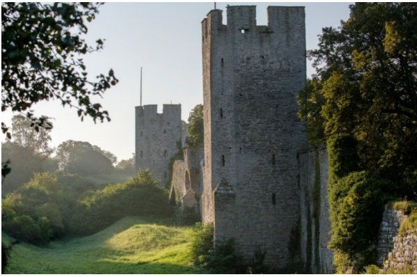
Download

Tidlösa skatter! Sverige gömmer vi inte våra skatter på öde öar, vi delar med oss av dem till alla. Här kan du uppleva världsarv som slott, naturreservat och arkeologiska fyndplatser. Varför inte ta en promenad genom den medeltida staden Visby på Gotland, eller utforska Laponiaområdet i Swedish Lapland, som ligger inom polcirkeln i norra Sverige. Dessa platser är skyddade av UNESCO så att alla kan njuta av dem för alltid.