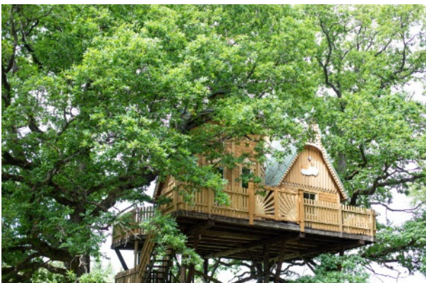
Download

Bo i en älg bland älgar: På Wrågårdens älg- och dovhjortspark nära Falköping erbjuds en annorlunda övernattningsupplevelse. Här kan besökare tillbringa natten i trähyddor formade som älgar och bisontjurar. Boendet erbjuder en härlig utsikt över älgägnet där man kan se dovhjortar och bisonoxar beta. Det finns även möjlighet att följa med på en Bison-safari. Pressbilder