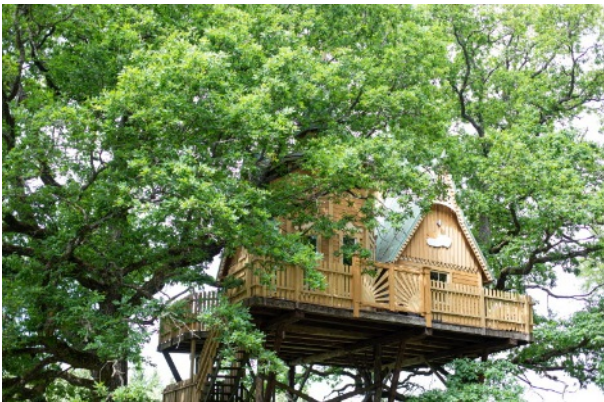
Download

Bo i en älg bland älgar: På Wrågårdens älg- och dovhjortspark nära Falköping erbjuds en annorlunda övernattningsupplevelse. Här kan besökare tillbringa natten i trähyddor formade som älgar och bisontjurar. Boendet erbjuder en härlig utsikt över älgägnet där man kan se dovhjortar och bisonoxar beta. Det finns även möjlighet att följa med på en Bison-safari. Pressbilder