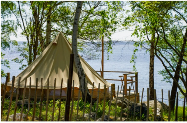
Download

Glampa med vikingar: På ön Björkö i Mälaren kan besökare mellan juni och september övernatta i lyxiga glampingtält och samtidigt få en inblick i vikingarnas fascinerande värld. De bekväma tälten erbjuder modern komfort och skön vila och står placerade alldeles vid Mälarens strand. Pressbilder