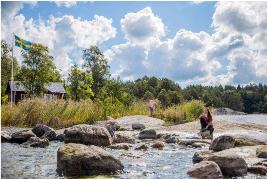
Photo : Maison de vacances dans l'archipel de Stockholm Télécharger

Avec son charme nordique et sa nature unique, la Suède est un lieu d'évasion idéal pour tous ceux qui cherchent à fuir les fortes chaleurs estivales.