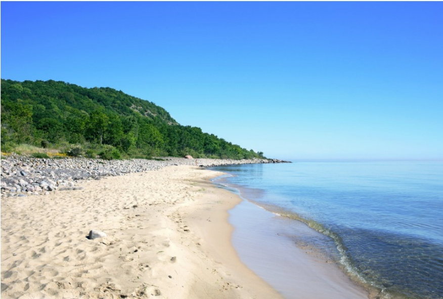
Photo : Stenshuvud est le parc national le plus méridional de Suède - Conny Fridh/imagebank.sweden.se Télécharger )

Envie de découvrir des destinations authentiques et surprenantes, loin des foules et des sentiers battus ? La Suède offre des bijoux cachés qui rivalisent avec des lieux prisés à travers le monde. Préparez-vous à être émerveillés par ces « dupes » de destinations célèbres qui promettent des expériences uniques et mémorables.