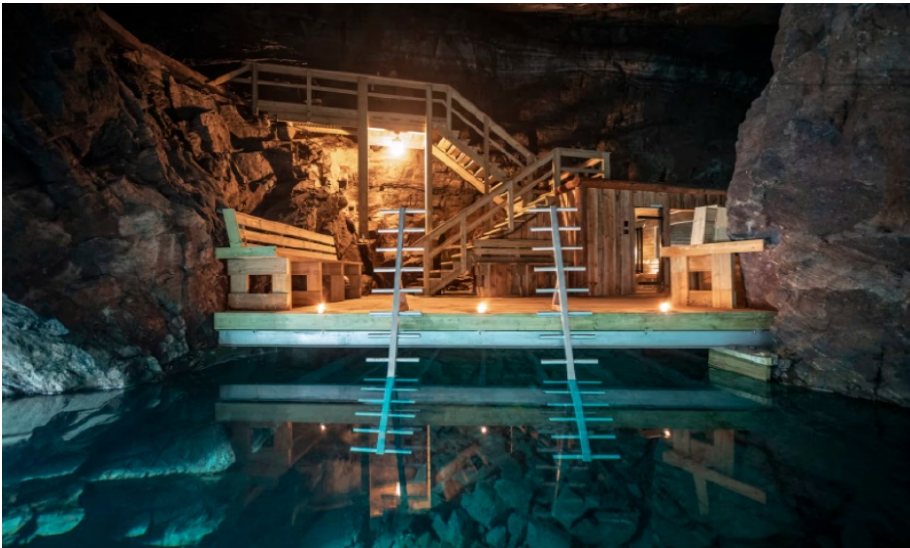
Adventure Mine Sauna, Credit: Visit Dalarna ( Download )

De Borlänge Adventure Mine was al langer bekend om zijn avontuurlijke rondleidingen. Vooral de turkooisblauwe ondergrondse Aurora-meren, waarvan het water qua kleur lijkt op het spectaculaire noorderlicht waren daarvan het hoogtepunt. Juist daar, 80 meter onder de grond, bevindt zich nu een gloednieuwe sauna. Je duikt er in het ijskoude, kristalheldere water en ervaart het "Lady of the Mine Sauna Ritual". Dat is een eerbetoon aan het mystieke wezen dat volgens de legende de mijn bewaakt. Het ritueel omvat verschillende elementen die de zintuigen stimuleren en wakker schudden, terwijl de endorfine door je lichaam stroomt.