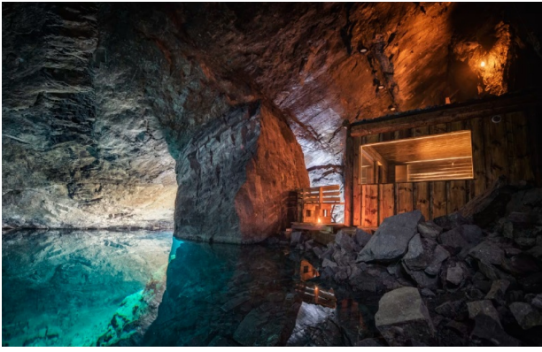
Adventure Mine Sauna, Credit: Visit Dalarna ( Download )

Jos olet hullaantunut saunoihin, maanalainen Adventure Mine -kaivoksen "Äventyrsgruvan" saattaa olla etsimäsi. Täällä vierailijat voivat käydä opastetuilla retkillä, jotka vievät syväälle maan alle laajoihin kalliokammioihin. Reitit ohittavat turkoosinsinisen maanalaisen Aurora-järven, jossa voit käydä kylpemässä kaivoksen kristallinkirkaassa vedessä ja nauttia saunasta, joka sijaitsee 80 metriä maanpinnan alapuolella! Kokemus on vielä voimakkaampi yhdistettynä Lady of the Mine -saunarituaaliin, joka on tarkoitettu kunnianosoitukseksi mystiselle olenolle, joka legendan mukaan vartioi kaivosta.